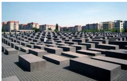
Mémorial de l'Holocaust