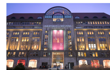
Kaufhaus des Westens