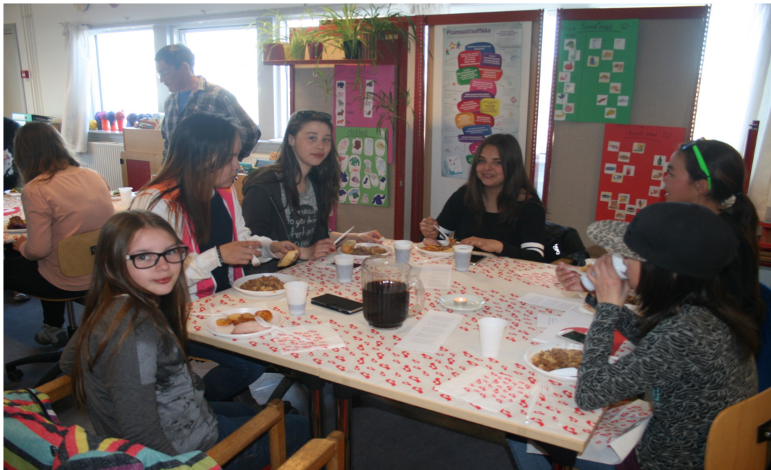
Ca mange et ça discute joyeusement à cette table...