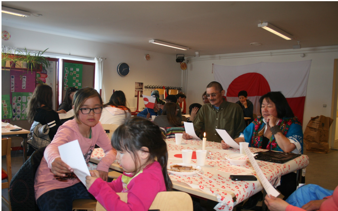
Tout le monde chante , même les enfants