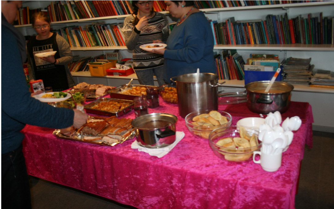
Une partie du buffet. Que des bonnes choses, notamment une soupe de poisson à tomber !