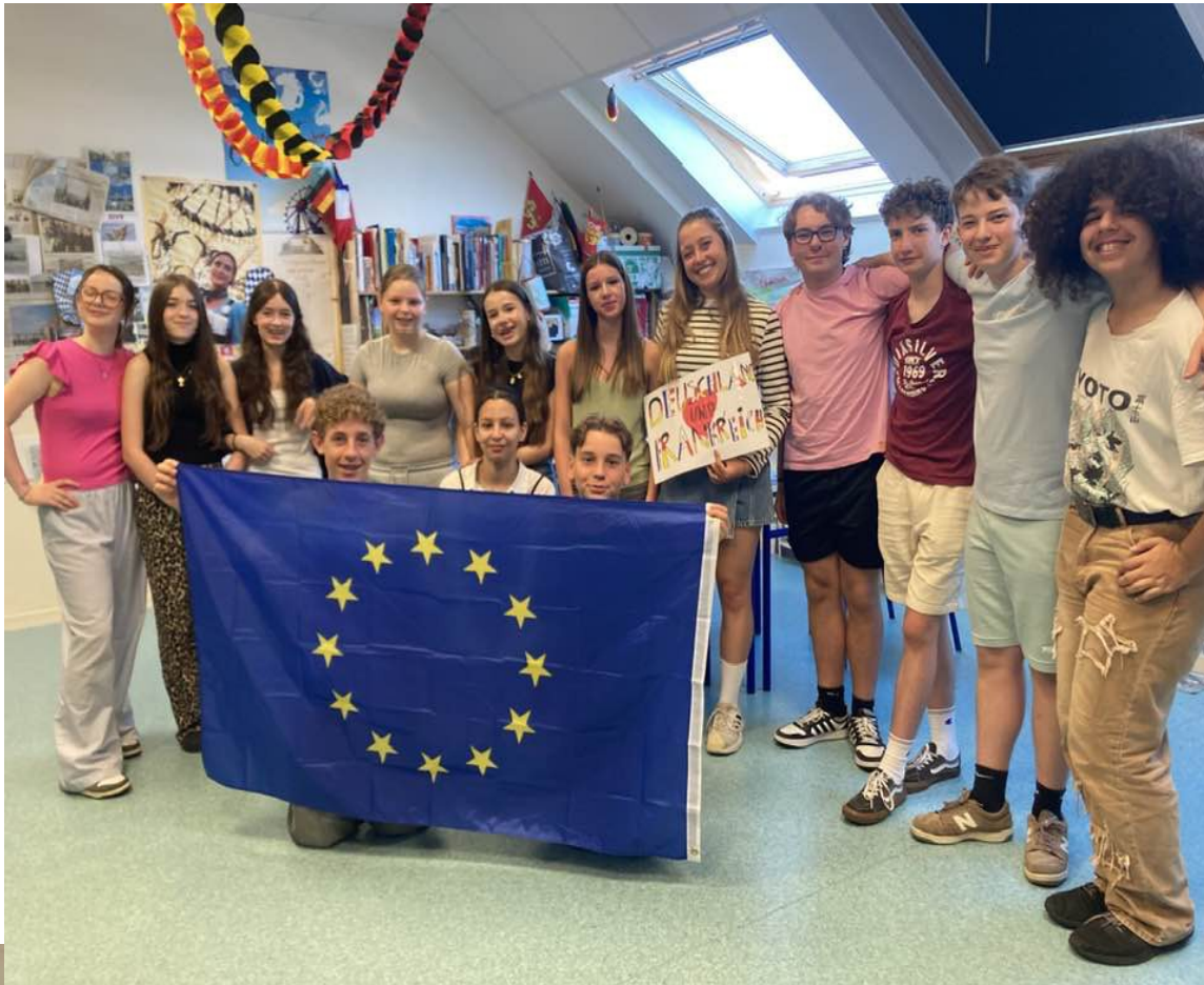
Mit den 9D-Klässlern (avec les 3èmes D)