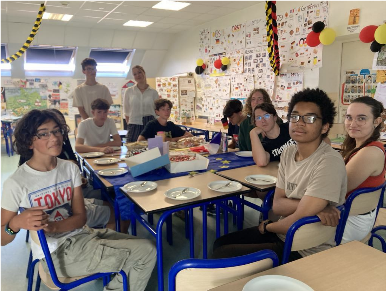
Mit den 9f-Klässlern (avec les germanistes de 3ème F)