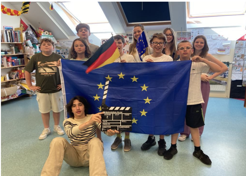
Mit den 7. Klässlern ( avec les 5èmes allemand LV2 ) (5BD)