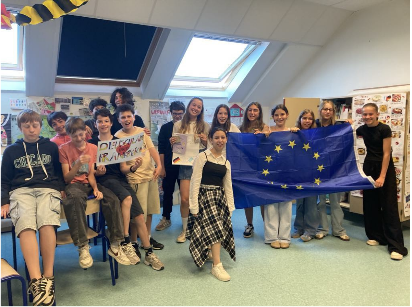
Mit den 8-Klässlern (4èmes DE)