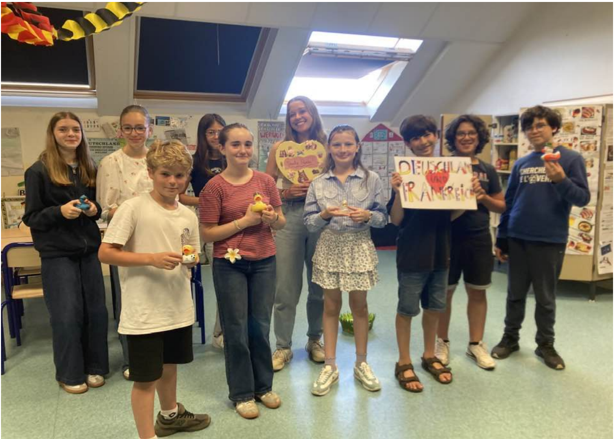
die 7-Klässler ( les 5èmes Bilangues ) (5E)