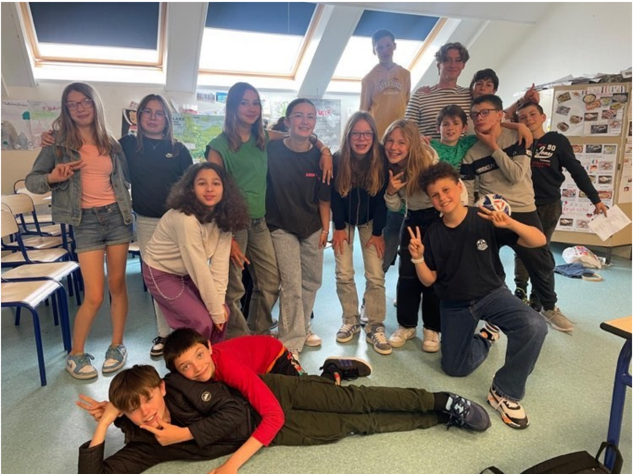
die 7-Klässler LV2 (5èmes LV2) (5CD)