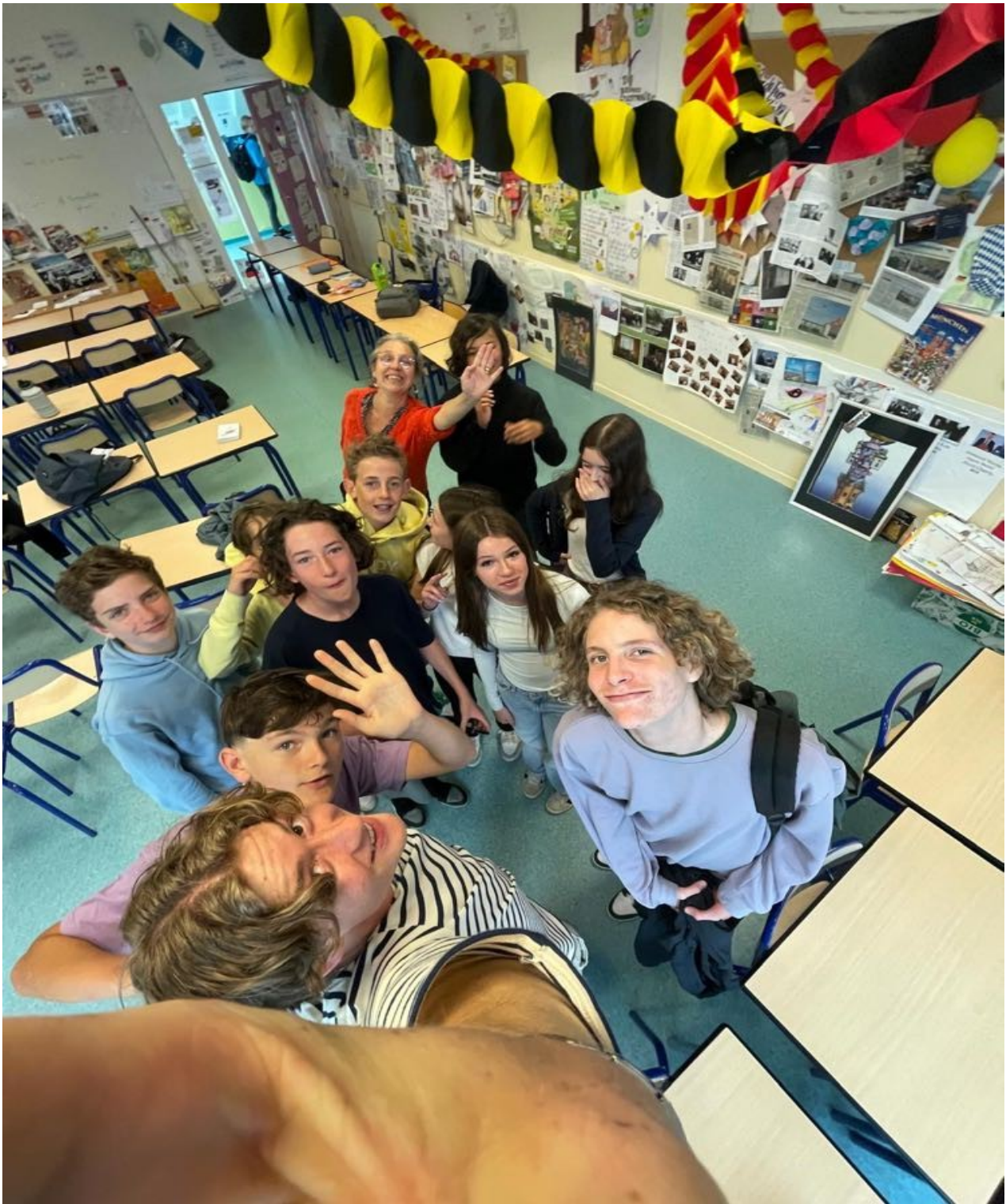
Mit den 8-Klässlern ( 4èmes Bilangues )