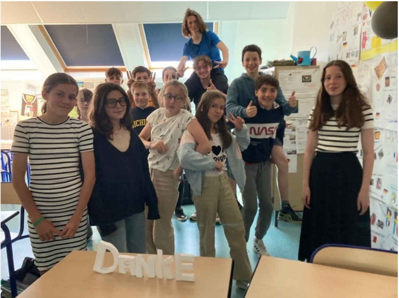
die 7-Klässler ( les 5èmes Bilangues ) (5DE)