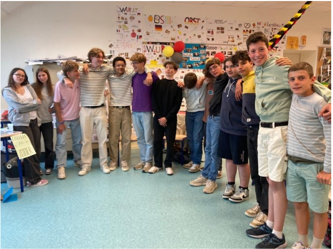
Mit den 9-Klässlern ( avec les 3èmes Bilangues et LV2 )