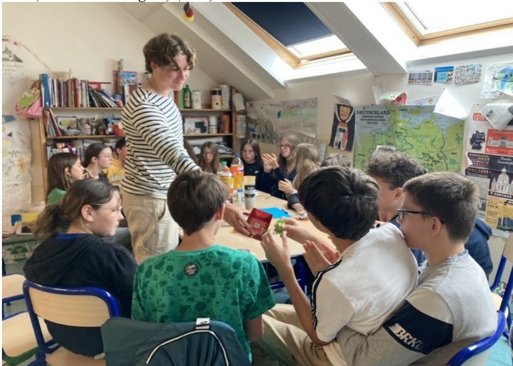
Mit den 7. Klässlern ( avec les 5èmes LV2 ) (5CD)