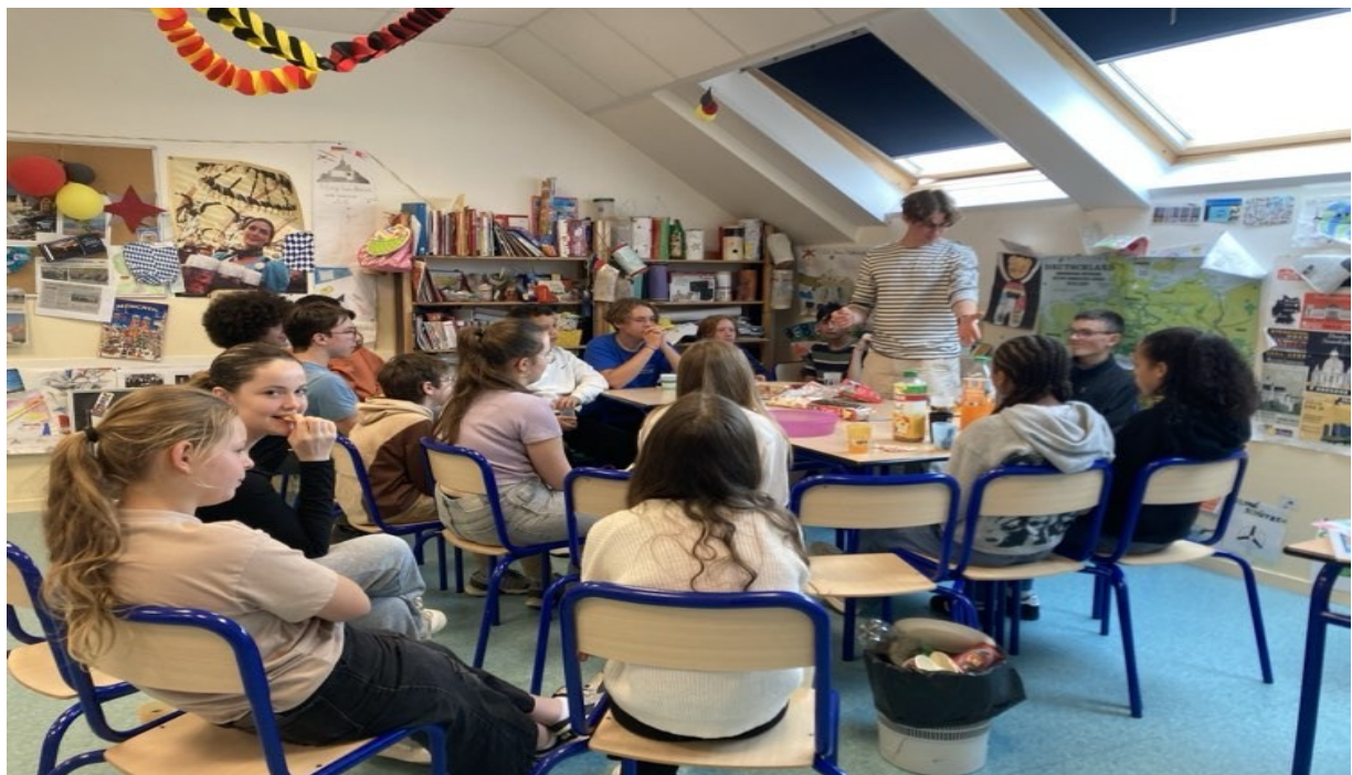
Mit den 8-Klässlern (avec les 4èmes LV2, 4DE)